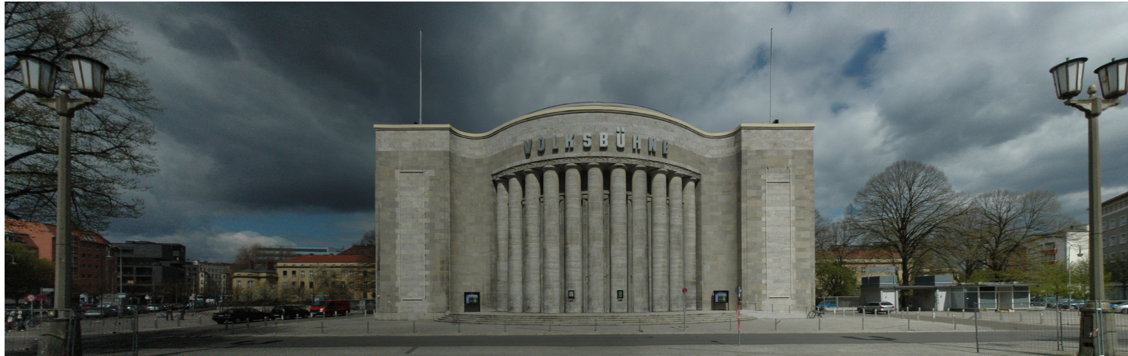
Fotomontage der Eingangsfassade der Volksbühne mit 5 neuen eingearbeiteten Säulen